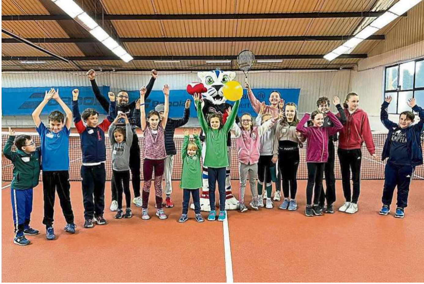
Beim Kick-off-Sporttag des neuen NAOK-Zentrums Rhein-Main-Neckar im Heppenheimer Sportpark konnten die Kinder verschiedene Sportarten testen.

Das Netzwerk ActiveOnco-Kids (NAOK) bietet für er-